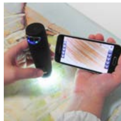
Acquisizione immagini in microscopia ottica digitale