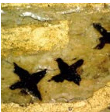
Doratura della decorazione dello scollo di una veste Ripresa con microscopio ottico digitale