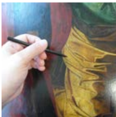
Analisi della fluorescenza X (XRF)