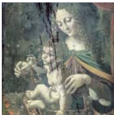
Osservazioni in luce diretta, radente e ultravioletta